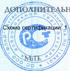
Схема сертификации: 1